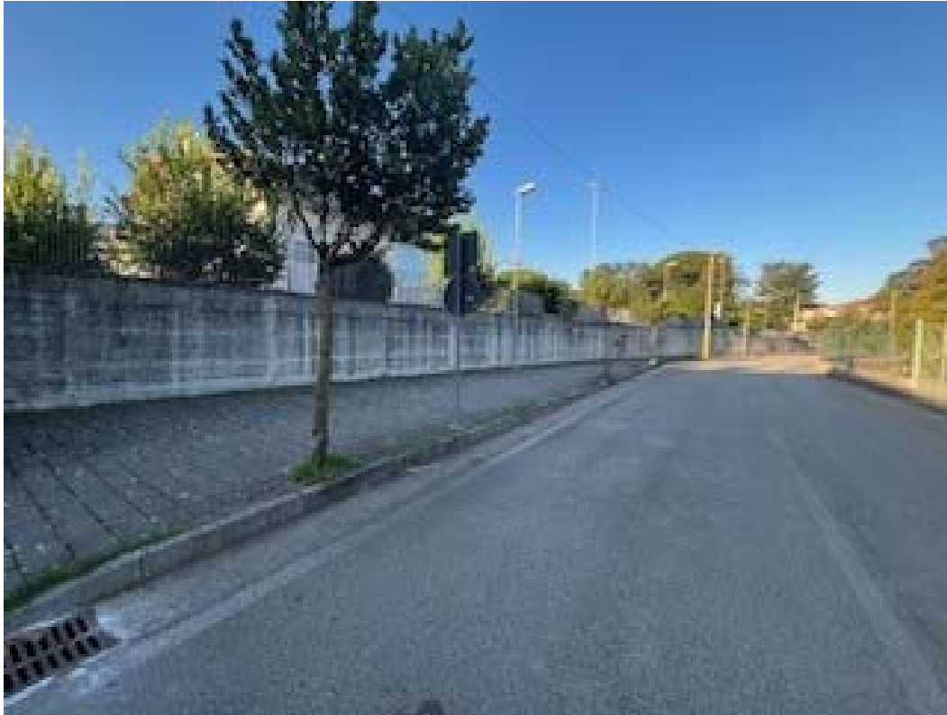
Muro su strada alla Via Sibelluccia

Provincia di Salerno 4^AREA - Area Tecnica Comunale